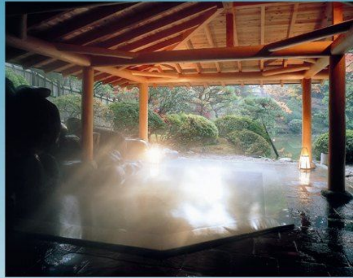
八幡平・湯瀬・大湯温泉郷